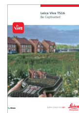
Leica Viva TS16