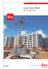
Leica Nova MS60